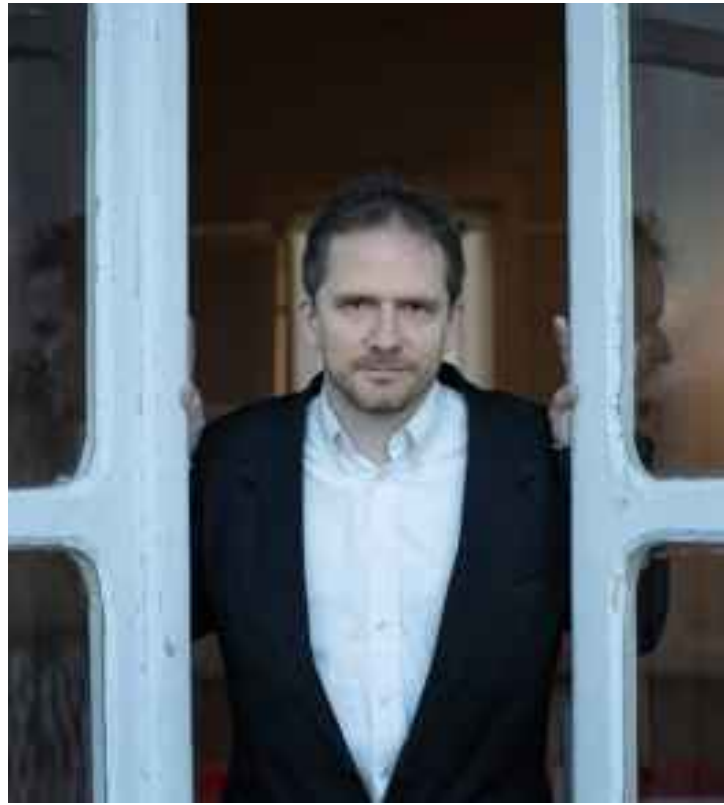
Le pianiste Karol Beffa accompagnera en musique et en direct le film muet de 1924.

Mercredi 13 août 2025, à 21 h 30, ciné-concert dans les jardins de La Grange aux pianos. Prix : 10 à 20 €.